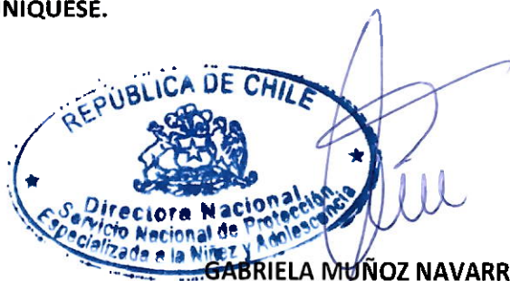
GABRIELA MUÑOZ NAVARRO DIRECTORA NACIONAL SERVICIO NACIONAL DE PROTECCIÓN ESPECIALIZADA A LA NIÑEZ Y ADOLESCENCIA